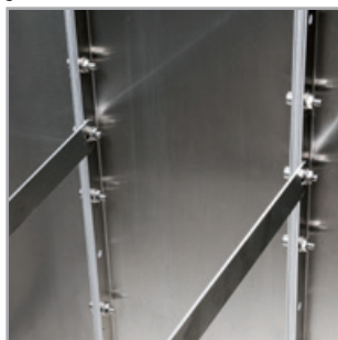
Die oberen Streben je nach Bepflanzung ggf. tiefer setzen.