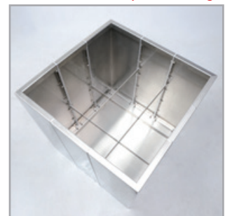
... folgen die Querstreben – fertig!