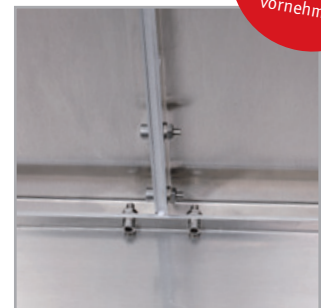
Schrauben: 5 St. bei 400 mm Höhe, 6 St. bei 650 mm Höhe; pro Verbindung!