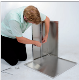
... und mit den langen Schrauben ( M6x20 ) handfest verbinden.