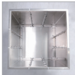
... bis der Pflanzkasten rundum geschlossen ist.