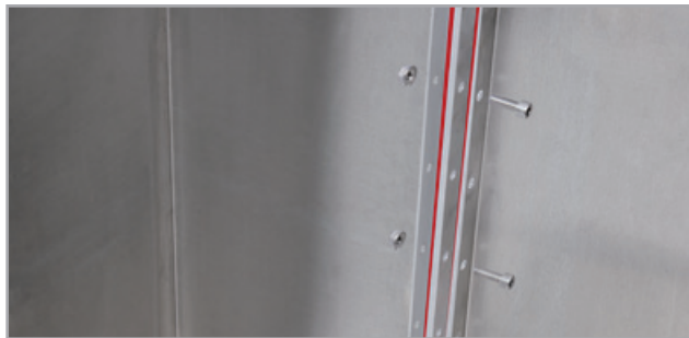
Zur Verbindung von Seitenteilen inkl. Lisene bitte die langen Schrauben ( M6x20 ) verwenden. Beim Pflanzkasten ohne Lisenen gibt es nur eine Sorte Schrauben (M6x16).