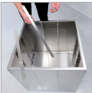
Die Zugstreben soweit wie möglich oben und unten montieren.