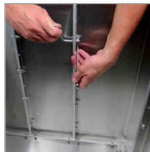
Alle Schrauben festziehen und die Pflanzkastenelemente in der Höhe ausrichten.