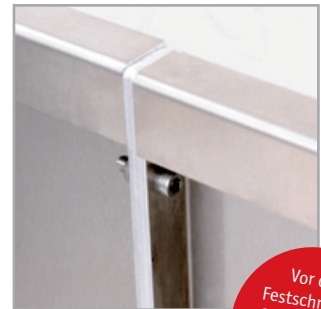
Die eingefasste Lisene.

Vor dem Festschrauben ggf. ausrichten und Höhenanpassungen vornehmen!