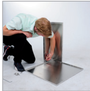
... mit den kurzen Schrauben ( M6x16 ) fixieren, ...