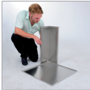
Ecke anlegen, ...