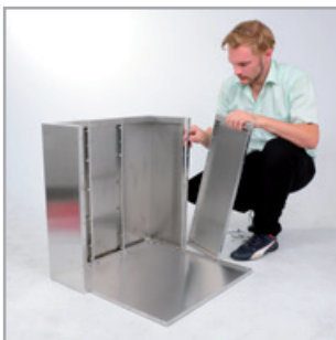
Die Schritte wiederhole, ...

Vor dem Festschrauben ggf. ausrichten und Höhenanpassungen vornehmen!