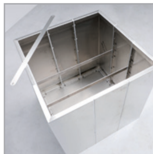
Wenn die Längsstreben montiert sind, ...