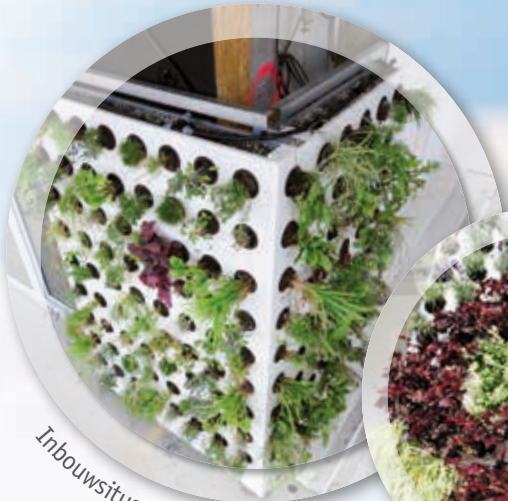
Inbuwsituaties Plantenwand Adam