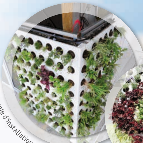
Exemple d'installation du mur végétalisé « Adam »